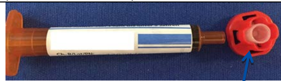
Figura 1. CORRETTA rimozione del cappuccio protettivo semitrasparente